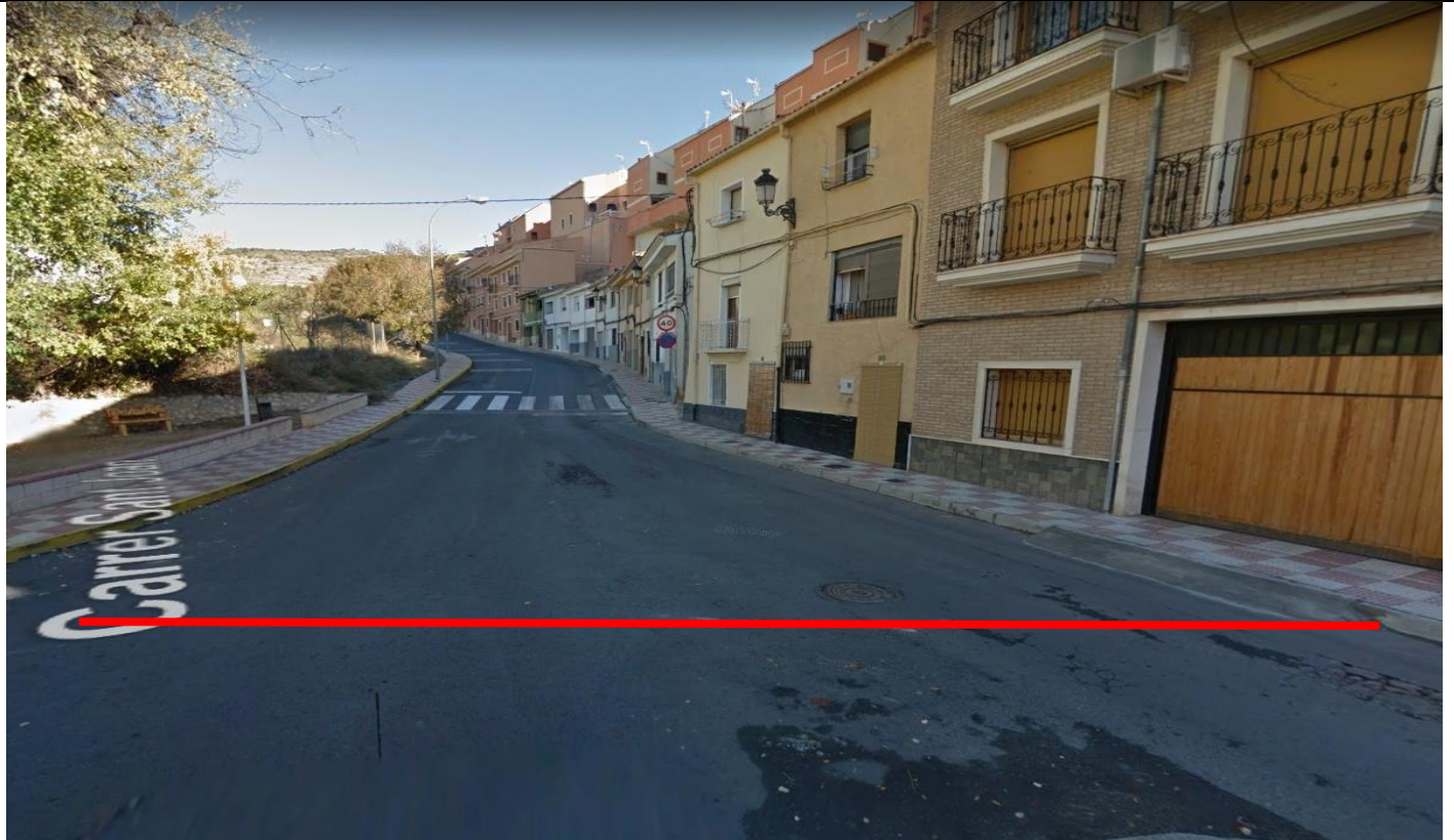
Foto de la META