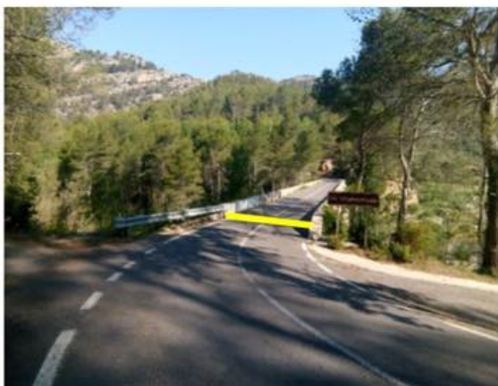
Salida 38,500 CV-190