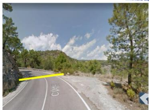
Llegada 42,700 CV-190