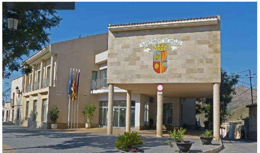
EL COMITÉ ORGANIZADOR.

AYUNTAMIENTO DE RELLEU. Oficina Permanente del Rallysprint, Tablón de avisos y Pódium. (Sábado 6)