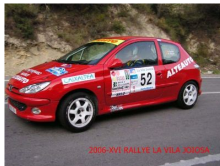
PEUGEOT 206 XS GR.A CL. III MATRICULA : 9861 BGV

CLASIFICACION FINAL RALLYE : 2º (441 PUNTOS) / 1º CL.VI