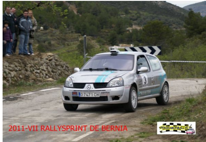
RENAULT CLIO SPORT F2000 CL.V MATRICULA : O-7471-CH

CLASIFICACION FINAL RALLYSPRINT : 11º (23 PUNTOS) / 6º CL.V (7 PUNTOS)