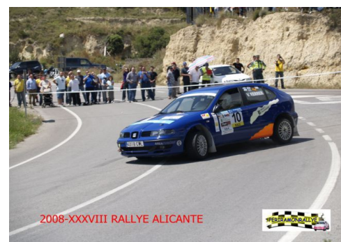
SEAT LEON DIESEL GR.A CL.VI MATRICULA : 4018 CWL