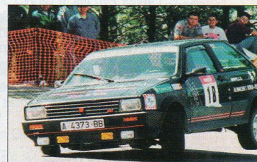
Con este Seat Ibiza debutó en una prueba de Montaña.