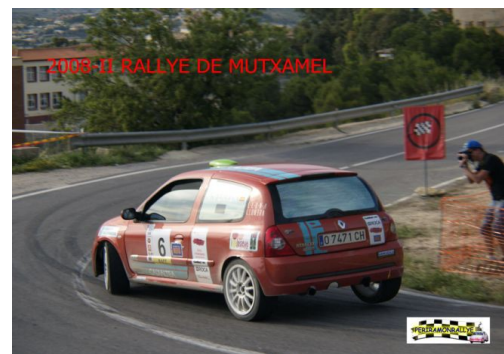
RENAULT CLIO SPORT F2000 CL.V/VIII MATRICULA : O-7471-CH