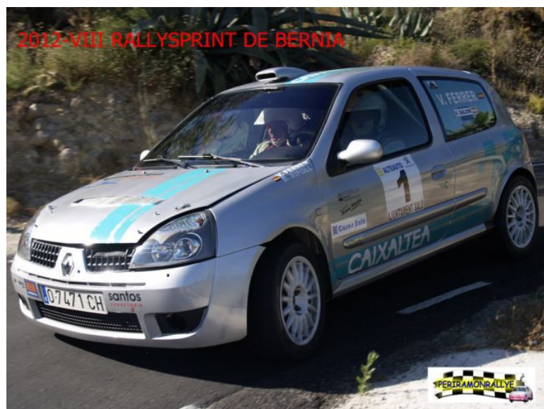
RENAULT CLIO SPORT F2000 CL.V MATRICULA : O-7471-CH