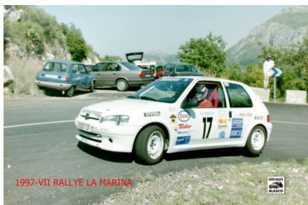
PEUGEOT 106 RALLYE 1.6 GR.N CL.II MATRICULA : A-6337-DF

CLASIFICACION : 6º DESAFIO PEUGEOT DEL MEDITERRANEO (174 PUNTOS)