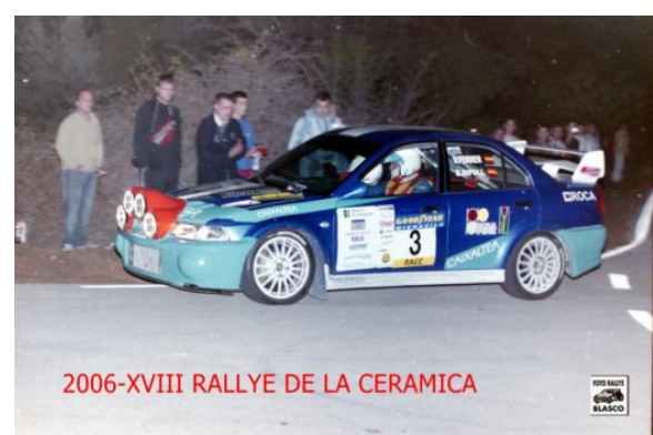
MITSUBISHI LANCER/CARISMA EVO VI GR.A CL.VI MATRICULA : A-9532-DY