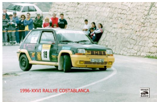
RENAULT 5 GT TURBO GR. F CL. XII MATRICULA A-1230-AS